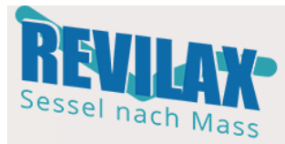
Abb. Revilax-Vitalax REVILAX-VITALAX